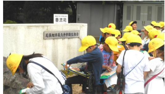
【 尾張旭市長久手市衛生組合 】

3年生の社会科の学習では、自分たちが住む地域について学習しています。5月8日・9日には、実際に探検をして地域の様子を見て回りました。住宅が多い所、田畑が多い所などの地域の違いに気付くことができました。また、公園や公共施設の位置を確認しました。