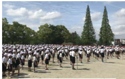
【 全校練習の様子 】

PTA手帳(P4)の「長久手小役員議事評議員名簿」に誤りがありました。P4・5ページについて、新しい名簿を配付いたします。よろしくお願いいたします。