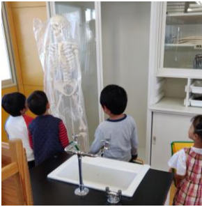
【 理科室 】

5月8日に、校内を探検しました。事前に、2年生と一緒に回り、様々な教室があることを教えてもらいました。今回は、スタンプラリーをしながらチェックポイントを目指して、楽しく探検しました。学校探検を通して、北小学校について少し詳しくなれたようです。