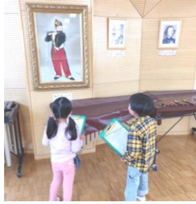
【 音楽室 】